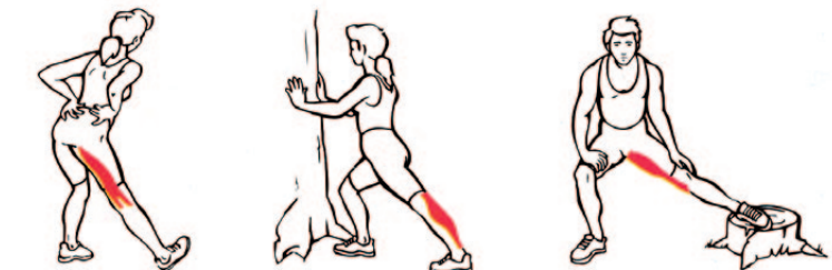
Aftanverðir lærvöðvar Kálfavöðvar (haltu hælnum á jörðinni) Innanvert læri

Í þessum bæklingi er ekki talað um 3. og 4. stig hlaupaþjálfunar. Ástæðan fyrir því er að eftir 18 vikna æfingar skv. þessari þjálfunar-áætlun átt þú sjálf/-ur að hafa fengið tilfinningu fyrir því hvernig best sé að haga áframhaldandi þjálfun.