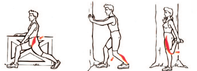
Beygjuvöðvar mjaðma (nári) Djúplægari kálfavöðvar (haltu hælnum á jörðinni) Framanverðir lærvöðvar